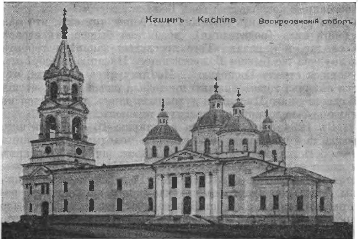
Воскресенскій соборъ въ г. Кашинѣ.

исторія объ этомъ ничего опредѣленнаго не говоритъ. По трудамъ нѣкоторыхъ изслѣдователей житія благовѣрной княгини—будто бы въ городѣ Кашинѣ, поэтому и считаютъ Кашинѣ роднымъ городомъ благочестивой княгини и ее самоѣ—Кашинской. Но это едва ли вѣрно. Русскія лѣтописи говорятъ: «Того же (6798—1290) лѣта, ходи князь Дмитрій Борисовичъ Ростовскій ко Теери ратью съ новго-