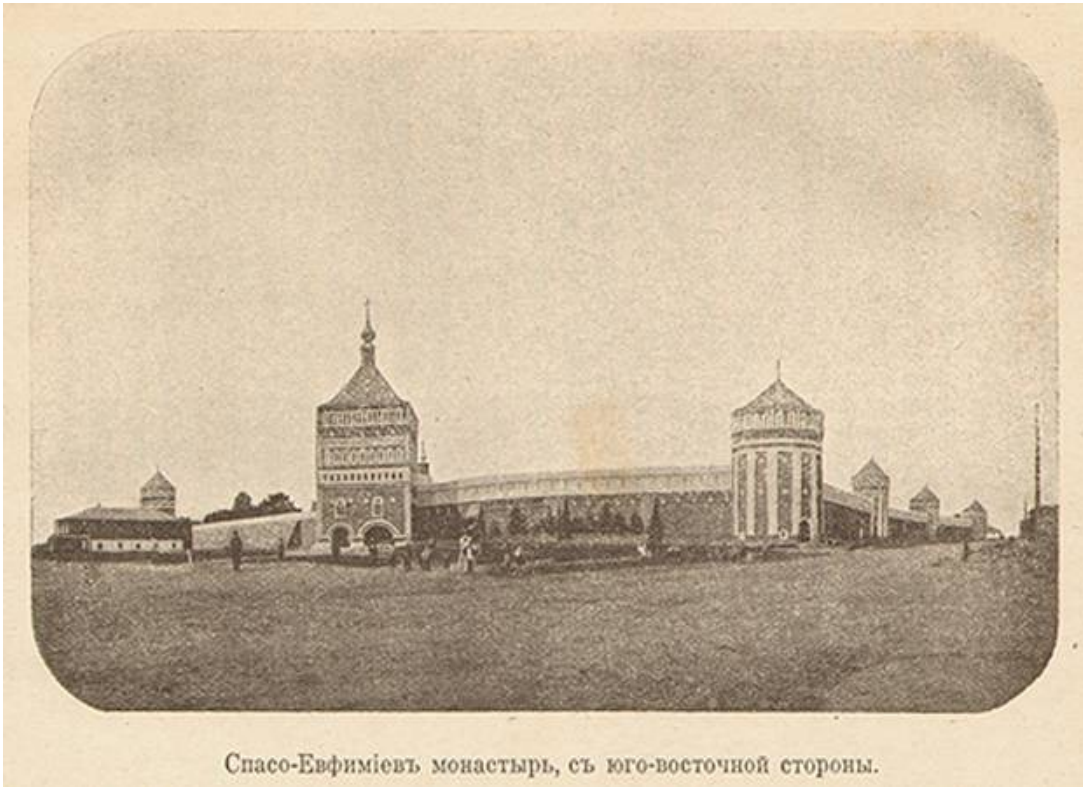
Спасо-Евфиміевъ монастырь, съ юго-восточной стороны.